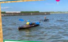
カヌーをうまく漕げるかな