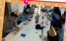
クリスマス会でニッコリ