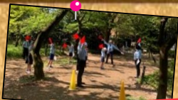
緑あふれる環境で活動しています!